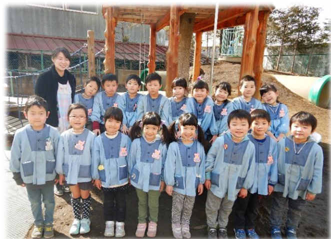
ひまわり組 たくさん遊んだ園庭で・・・

入園時はヨチヨチ歩きのお友達も、今はお戸外で元気に歩き、階段も手すりにつかまり昇り降りができるようになりました。最近はズボンも自分で履こうとする姿が見られます。積木を積んで「倒す」ことが大好きで、自分で積んだ積木も私達が積んだ積木も見つけると倒して手をたたいて喜びます。時には玩具の取り合いもしますが、型入れは順番に待って入れています。「おりこうさんね」と褒めると頭を「なでなで」したり、お友達のお名前が言えるようになったり、そんな成長がとても微笑ましい毎日です。行き届かないところもあったと思いますが、保護者の皆様には温かく見守っていただきありがとうございました。